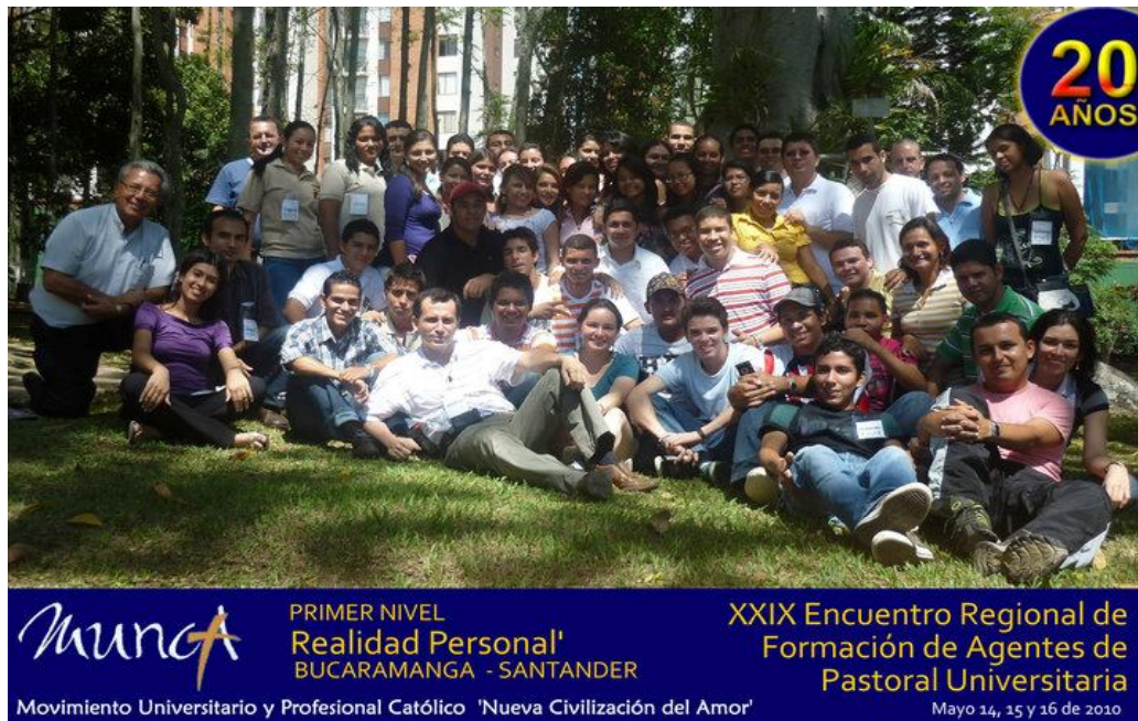
Participantes y Organizadores XXIX Encuentro I Nivel

Casa de Retiros Villasunción, Bucaramanga (Santander, Colombia) Mayo 14, 15 y 16 de 2010