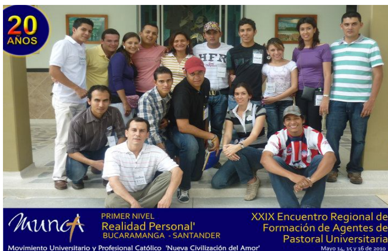
Equipo Organizador XXIX Encuentro